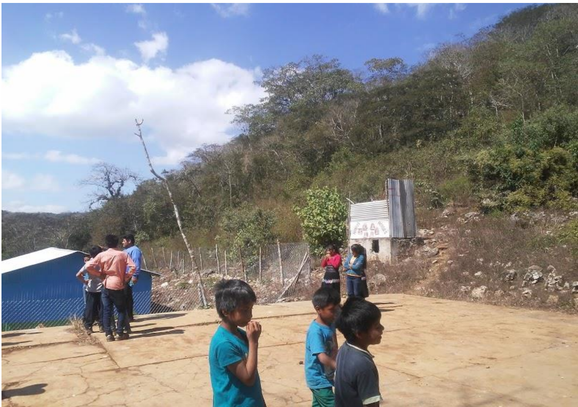
Ilustración 8 Cerca, donde pueda verte