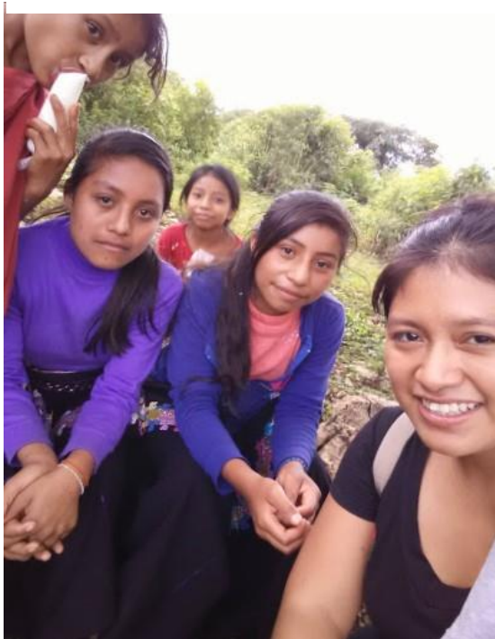
Ilustración 7 Alumnas de secundaria

tomada en Tierra Colorada, Chiapas. Octubre del 2020