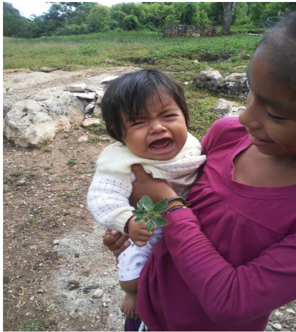
Ilustración 6 Con el hermano menor